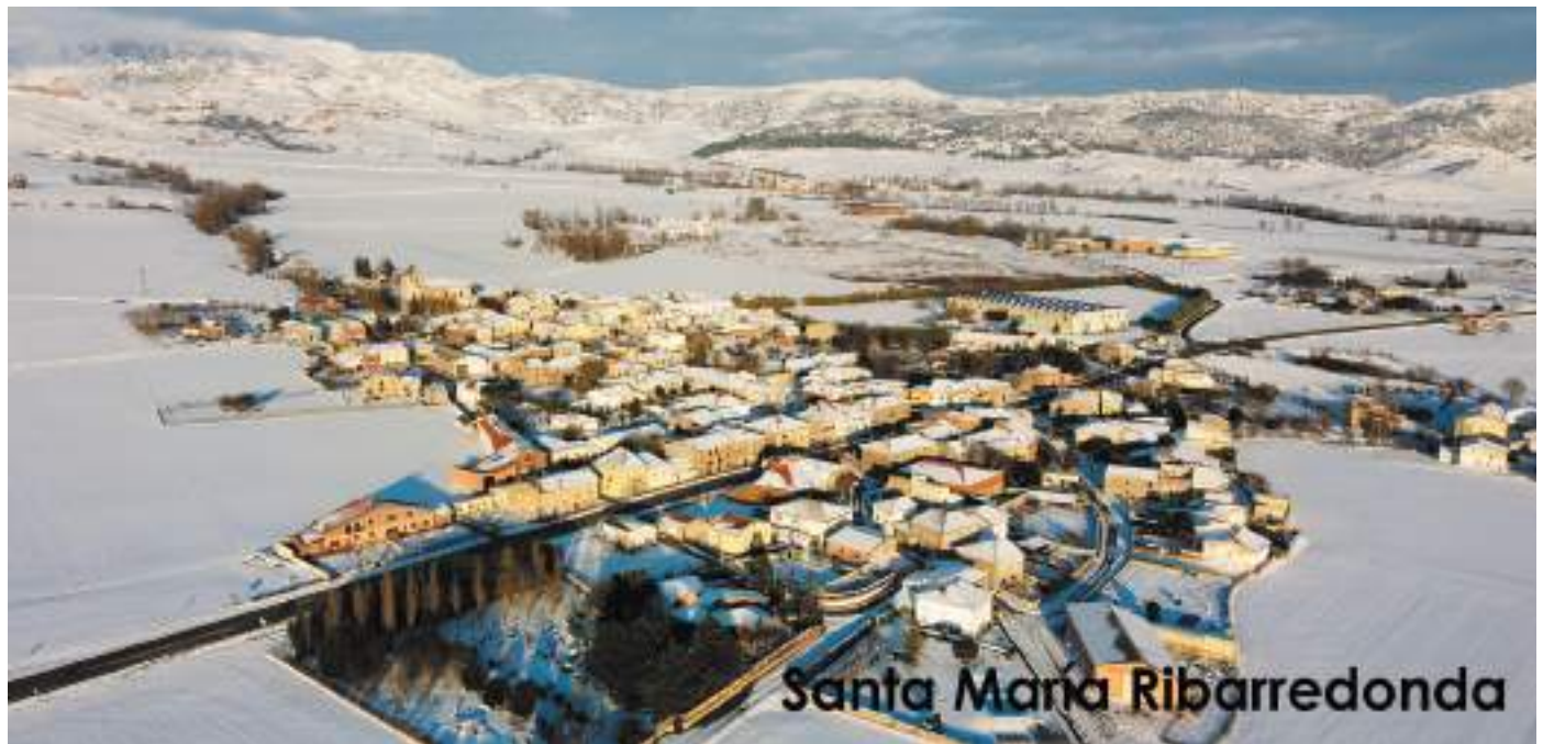
Santa María Ribarredonda