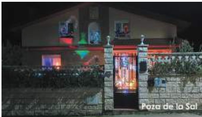
Poza de la Sal