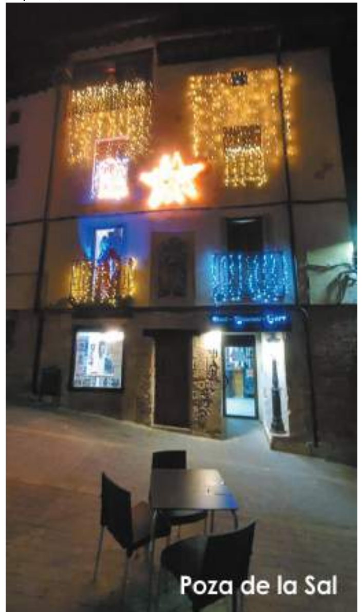
Poza de la Sal

Vileña es un clásico en la decoración navideña. Cada año, los vecinos realizan adornos, adornan las calles con ellos, y realizan un mercadillo muy animado que este año por la pandemia no se ha podido celebrar. A pesar de esto, no han querido renunciar a esta tradición y han querido adornar las calles de la localidad para no olvidar que, a pesar de que han sido un tanto atípicas, estábamos en Navidad.