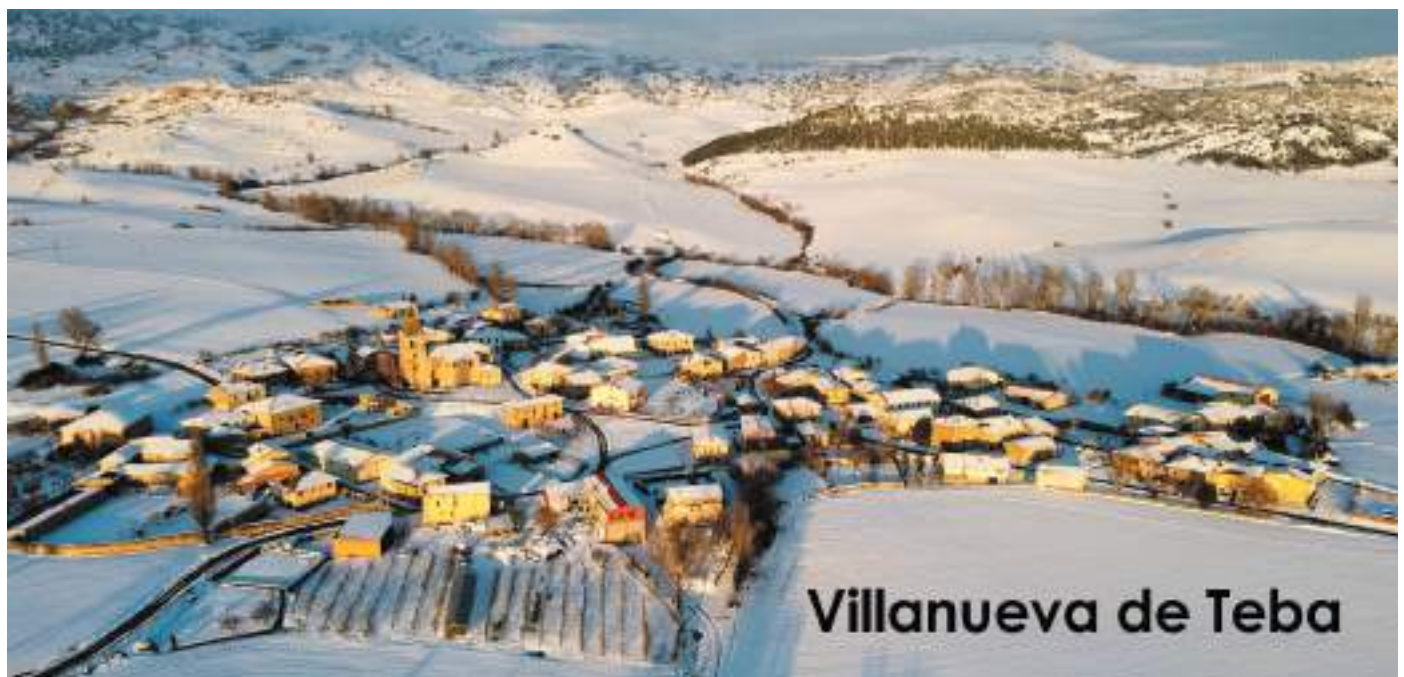
Villanueva de Teba