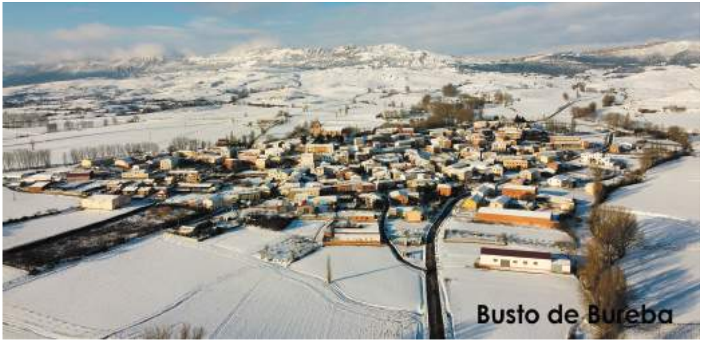
Busto de Bureba