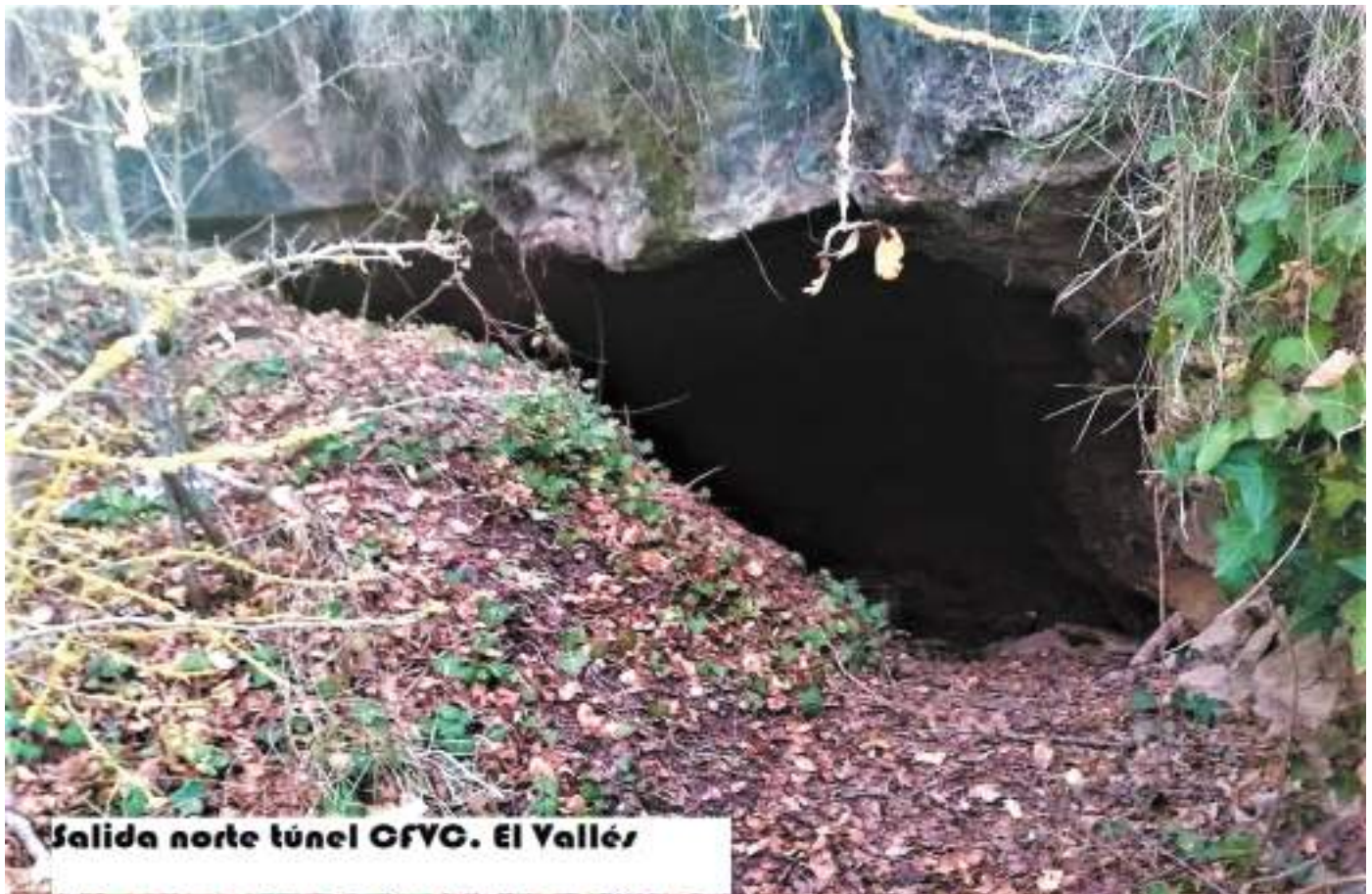
Salida norte túnel CFYC. El Vallés

A la altura de comienzos del siglo XX, los grupos de braceros gallegos se organizaban por familias o amistades normalmente dentro de un mismo municipio, y, en muchos casos, se informaba de sus características (nombre, edad, etc.) desde su propia localidad de origen hacia la que iban destinados. El grupo de trabajadores era dirigido, normalmente, por el denominado “mayoral de cuadrilla”, una especie de capataz que se ocupaba del bienestar y de negociar las contrataciones de dicho grupo. No era extra-