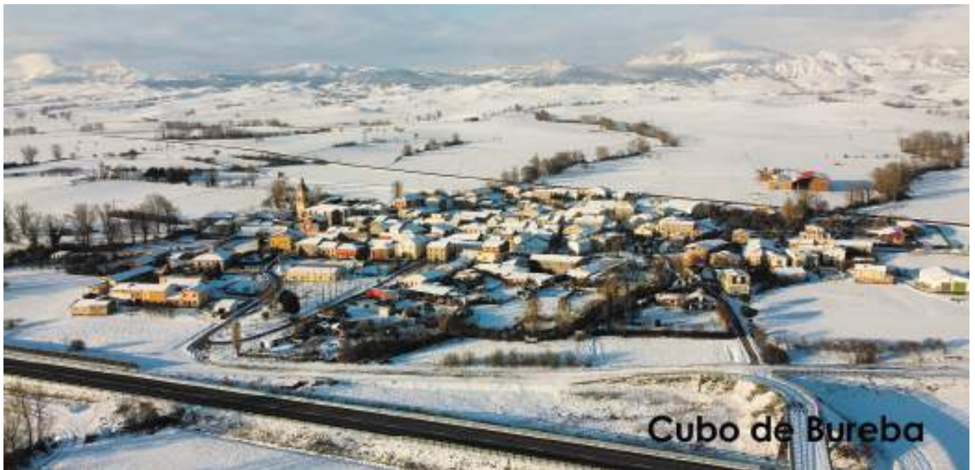
Cubo de Bureba