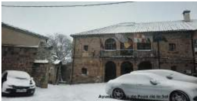
Ayuntamiento de Poza de la Sierra

En todas ellas se puede apreciar la belleza de la nieve en los paisajes burebanos, aunque a veces, ocasione más de un problema, pero nos quedamos con el refrán “Año de nieves, año de bienes”.