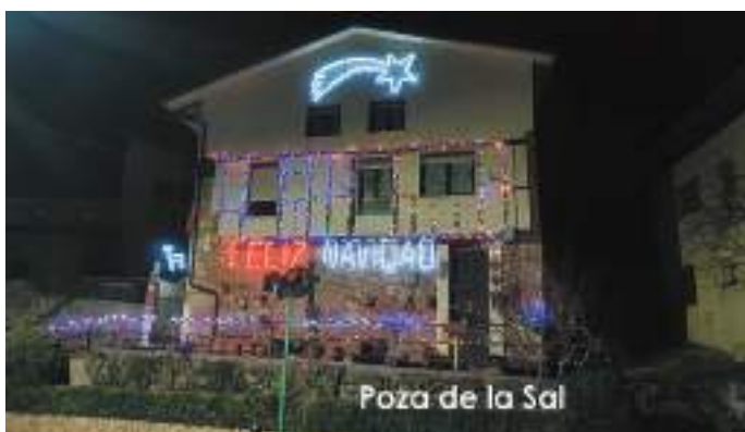
Poza de la Sal

Callejear por Poza de la Sal estas navidades, ha permitido disfrutar de los adornos, luces y música que ha llenado la villa salinera. La iniciativa del Concurso de Fachadas Navideñas, que este año llegaba a su tercera edición, ha contado con la participación de 28 fachadas, y animan a todos los que este año las han decorado y no han participado, y a los que no las han adornado, a que el próximo año se animen y participen en este bonito concurso.