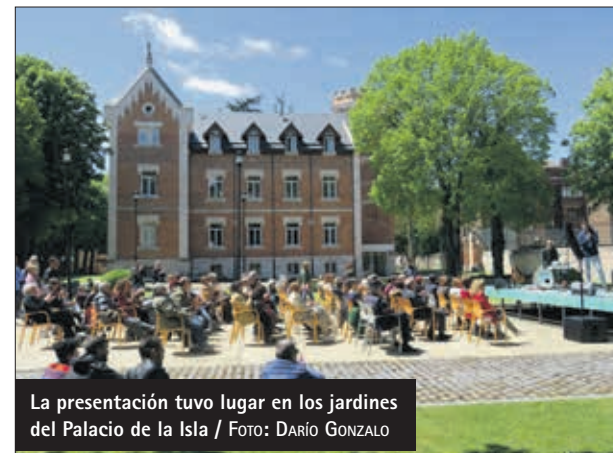
La presentación tuvo lugar en los jardines del Palacio de la Isla