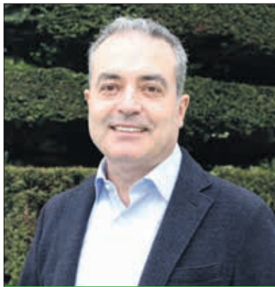
Ángel Martín, candidato a la Alcaldía por Vox