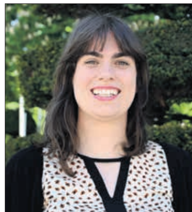
Eugenia Sáez, candidata a la Alcaldía por Imagina

ciones municipales en la ciudad, como ganamos las pasadas elecciones generales. Ya hemos demostrado nuestra capacidad para transformar las políticas del PP a pesar de estar en la oposición, nuestra capacidad para coger las riendas del gobierno municipal. Representamos el proyecto que mejor representa a la gran mayoría de los burgaleses, la que mejor conoce el Ayuntamiento y la única que puede derrotar a una confluencia de gobierno entre el PP y VOX.