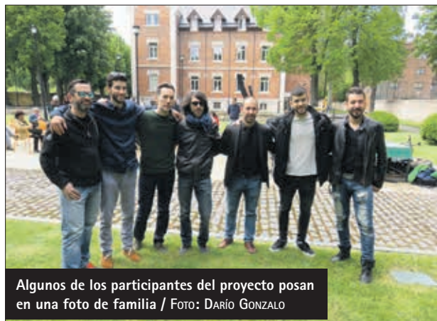
Algunos de los participantes del proyecto posan en una foto de familia