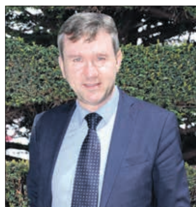
Javier Lacalle, candidato a la Alcaldía por el Partido Popular