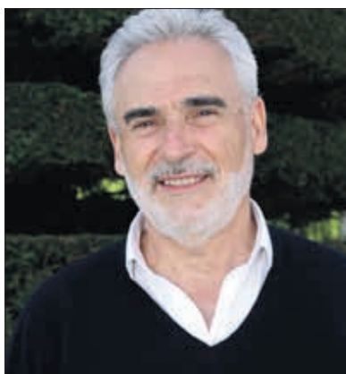
Marco Antonio Manjón, candidato a la Alcaldía de Vecinos por Burgos

Somos un proyecto de cambio, de futuro y de progreso. Hemos elaborado un programa de gobierno para sentar las bases de una mejor ciudad. Hemos mostrado que tenemos las ganas y la capacidad de luchar contra la corrupción y el amiguismo. Defendemos una ciudad que piensa en su gente, no en que unos pocos se enriquezcan a costa de la mayoría. Queremos que Burgos sea Burgos, vivible, accesible, sostenible, sensible con la diversidad, con futuro, incubadora de la cultura, capital del castellano, transparente, participativa, capital del deporte de base y comprometida con sus barrios.