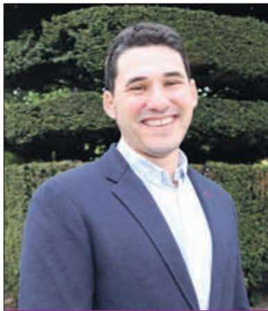
Raúl Salinero, candidato a la Alcaldía de Podemos