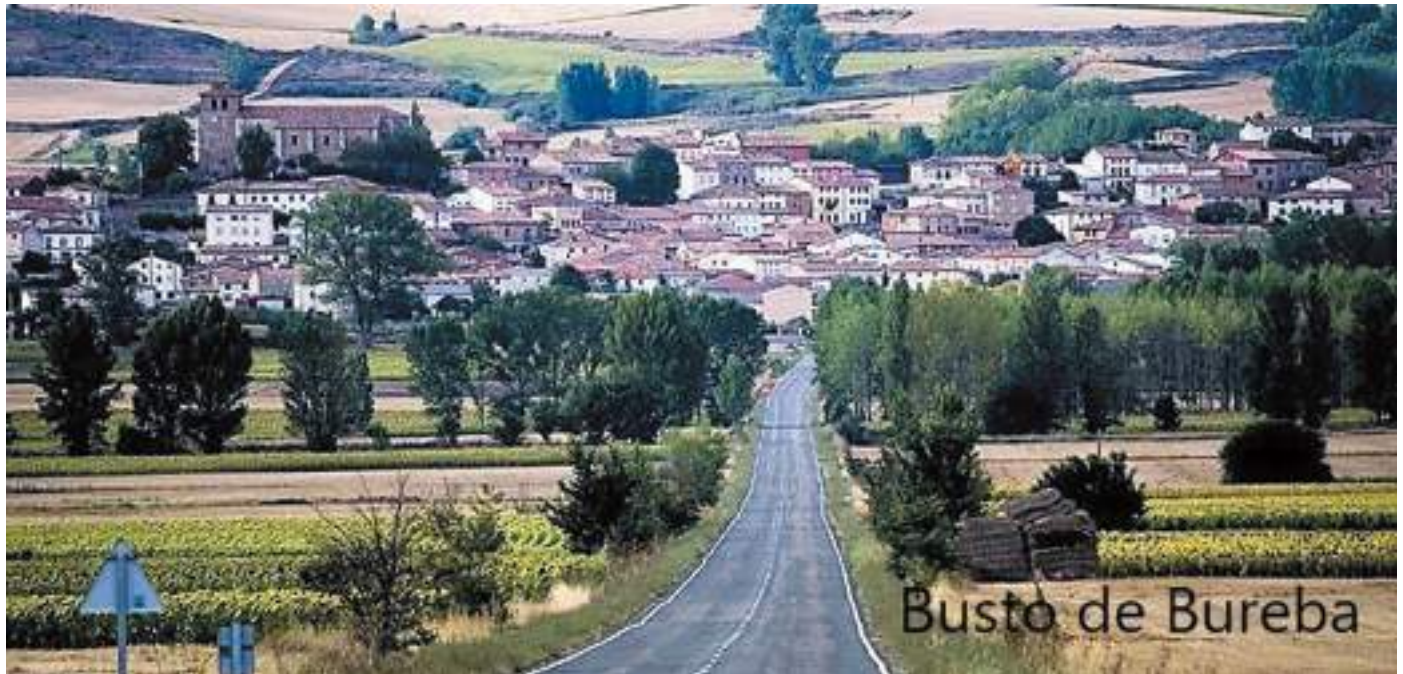
Busto de Bureba

reglas, y las sociedades auténticamente violentas son conscientes siempre y de forma aguda de esas «reglas». Y es que la violencia en la sociedad rural de los siglos XIX y XX no era algo fatuo y superficial, sino que tenía una función socio-cultural para sus individuos, el mantenimiento del status quo en las relaciones intracomunitarias” (Pág. 368). Y nos añade que “...la violencia que se ejerció en las comunidades estudiadas estaba incorporada a la vida cotidiana con absoluta regularidad y fue asimilada por sus integrantes como un recurso natural de relación social y defensa de intereses... las sociedades rurales estudiadas en este texto eran violentas por la concepción que tenían los individuos del uso de la violencia, aceptándola como parte activa de las relaciones sociales de la vida cotidiana” (Pág. 369).