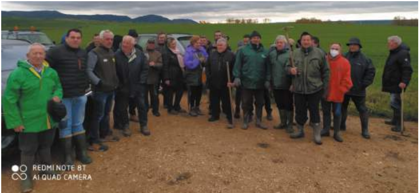
Busto de Bureba