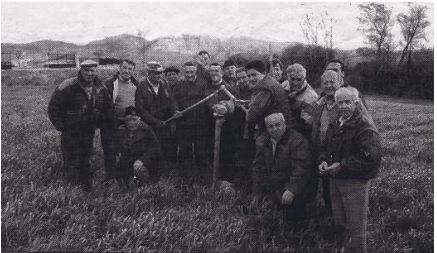
Foto tomada de un periódico con el siguiente texto: "Miraveche renueva la tradición del recorrido de mojoneras. Autoridades locales y vecinos de Miraveche renovaron un año más el recorrido de las mojoneras con vecinos de Busto, Cubo y Cascajares. Tras el recorrido los participantes se reunieron para jugar al fútbol y a las chapas y para degustar huevos cocidos. Este año la cita lúdica tuvo lugar en Busto de Bureba. Los alcaldes de las tres localidades expresaron su deseo de seguir celebrando este rito en años posteriores"

La foto en blanco y negro está sacada de una publicación del Diario de Burgos de principio de los años 90, vecinos de los pueblos celebrando este acontecimiento.