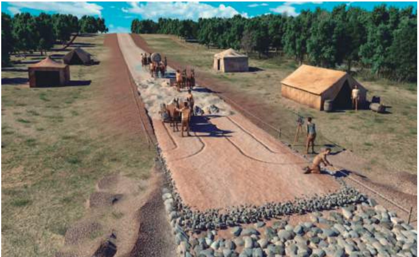
Simulación de la construcción de una vía romana ©Isaac Moreno Gallo

Por el este de La Bureba tenemos la calzada "Ad Asturica Tarracone" (Iter XXXII del itinerario de Antonino) vía que arrancando en Tarragona, pasaba por Zaragoza (Cesaraugusta), Alfaro (Graccurris), Calahorra (Calagurris), Tricio (Tritium Megalon) y Cerezo de Río Tirón (Segisamunculum). La mansio de Cerezo se sitúa en el término llamado Valdemoros, a 1 km al oeste del pueblo y el trazado desde Cerezo a Briviesca pasaba por los términos de Quintanalaranco, Quintanilla San García y Bañuelos, por la zona que se llama "Carrera de los romanos". En este tra-