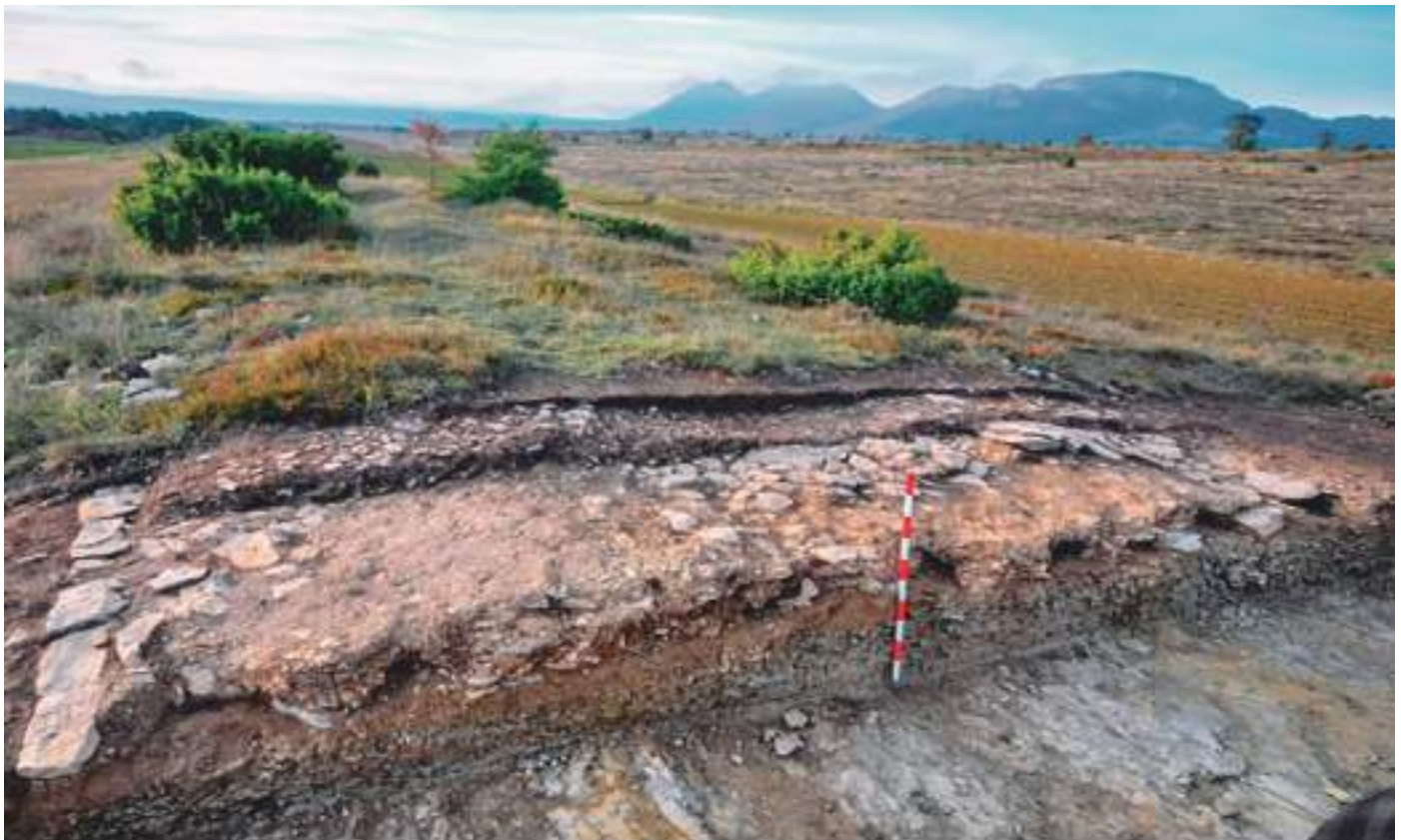
Corte transversal de una calzada donde se aprecian los materiales con la que se construyó

Su sistema de construcción era parecido al macadamizado o macadán, un método de pavimentación revolucionario inventado por John McAdam a principios del siglo XIX, basado en capas de piedras trituradas y grava compactadas para formar una superficie firme, drenante y resistente. Sin saberlo copió el mismo método de los romanos, y que es el origen de las carreteras modernas. Las calzadas romanas, verdadera columna vertebral del imperio no se construían para ir a conquistar territorios. No eran vías militares. Las construían en territorios ya dominados, para comunicar las ciudades, facilitar el transporte